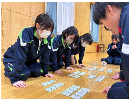
3年生の活躍が光る源平合戦